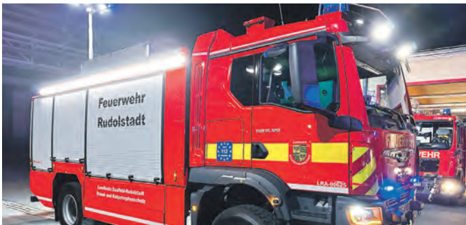
Das neue TLF 4000 wurde vom Landkreis beschafft und bei der Feuerwehr Rudolstadt stationiert.

Liter Wassertank sowie einen fest eingebauten Schaummittel tank mit einem Fassungsvermögen von 500 Litern inklusive Druckzuzumischanlage, um bei Bedarf schnell Löschschaum zu erzeugen. Das Fahrzeug ist für die Wasserversorgung bei Brandeinsätzen aller Art vorgesehen und stellt insbesondere in Gebieten mit unzureichender Löschwasserversorgung einen großen Mehrwert dar. Dieses Fahrzeug ist bei der Feuerwehr Rudolstadt stationiert und wird für überörtliche Einsätze im Landkreis eingesetzt. In den nächsten Monaten werden noch ein HLF 10 für den Standort Pflanzworbach und ein TLF 3000 für den Standort Rudolstadt beschafft. Für diese Fahrzeuge laufen derzeit die Rohbaubesprechungen bei der Firma Rosenbauer. „Das Fahrzeug ist ein weiterer wichtiger Baustein in unserem Gefahrenabwehrkonzept für den Landkreis“, sagte Landrat Marko Wolfram. In diesem Jahr werden für 3,4 Millionen Euro Fahrzeuge beschafft.